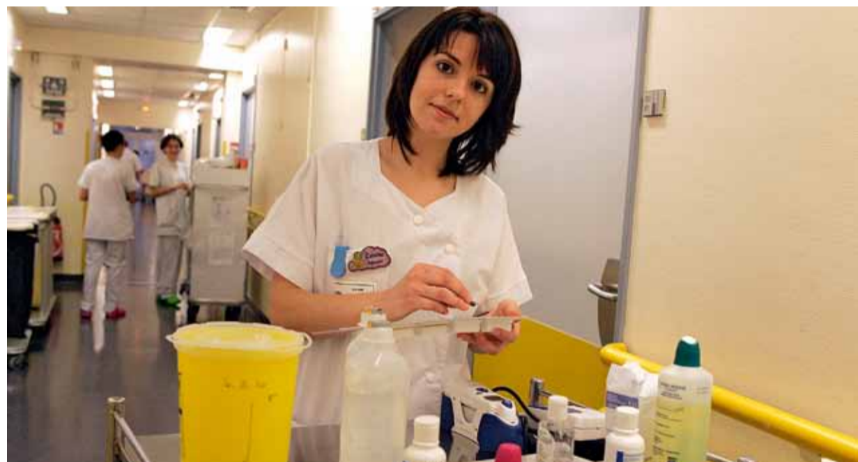
Les deux cliniques arriveront à Sénart avec 330 employés (personnel administratif et soignant) et 70 praticiens.

Les responsables des cliniques Saint-Jean l'Ermitage, situées à Melun et Dammarie-les-Lys mais regroupées au sein du même établissement depuis 2005, ont décidé de se réunir définitivement en réalisant un bâtiment neuf à Sénart à l'horizon 2012. Le premier équipement de santé significatif de la ville nouvelle depuis sa création.