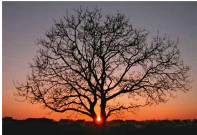
L'arbre des Cités Unies, à Savigny, par Alain Schreiner, extrait de notre collection "Votre aggro comme vous la voyez".

Pour la troisième année consécutive, la Maison de l'Environnement (service d'éducation à l'environnement du San) met les Sénartais à contribution dans le cadre de la Semaine du développement durable. Pour cette édition 2010, elle vous propose de vous emparer de vos stylos, crayons, pinceaux ou de votre appareil photo et de laisser libre cours à votre inspiration pour imaginer et représenter les comportements à adopter pour vivre dans un monde plus sain. Une fois n'est pas coutume, cette démarche d'expression libre est proposée aux plus de 15 ans et aux adultes. Vous avez jusqu'au 1 er avril pour adresser vos œuvres à la Maison de l'environnement, par courrier ou par mail, avec vos coordonnées. Votre création (écrit, dessin,