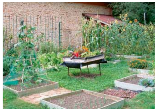
Une expérience de potager bio en carré à la Maison de l'environnement.

Personnellement les taupes ne m'ont jamais dérangé, c'est un bel animal (ce n'est pas un rongeur) qui se nourrit de vers ou d'insectes, ses nombreuses galeries aèrent le sol mais peuvent faire des dégâts. On peut récupérer la terre des monticules et l'utiliser pour les plantations. Si vous voulez les repousser plantez ail, herbes à taupes (euphorbe), jacinthes, jonquilles, oignon, graines de ricin, toutes ont fait leur preuve. Pour les limaces