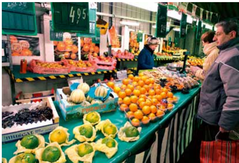
Le marché, garant de la qualité de vie et de l’animation du cœur de ville.

le choix entre deux ou trois marchands pour chaque catégorie de produits.” En attendant la reconstruction, la structure vieillissante est bien entretenue : les toilettes publiques viennent d’être refaites et le sol est réparé régulièrement. Pour faire revivre cette structure économique centrale, la municipalité a décidé de lancer l’opération Combs-la-Ville aime son marché . Tous les outils de communication de la mairie sont mis à contribution.