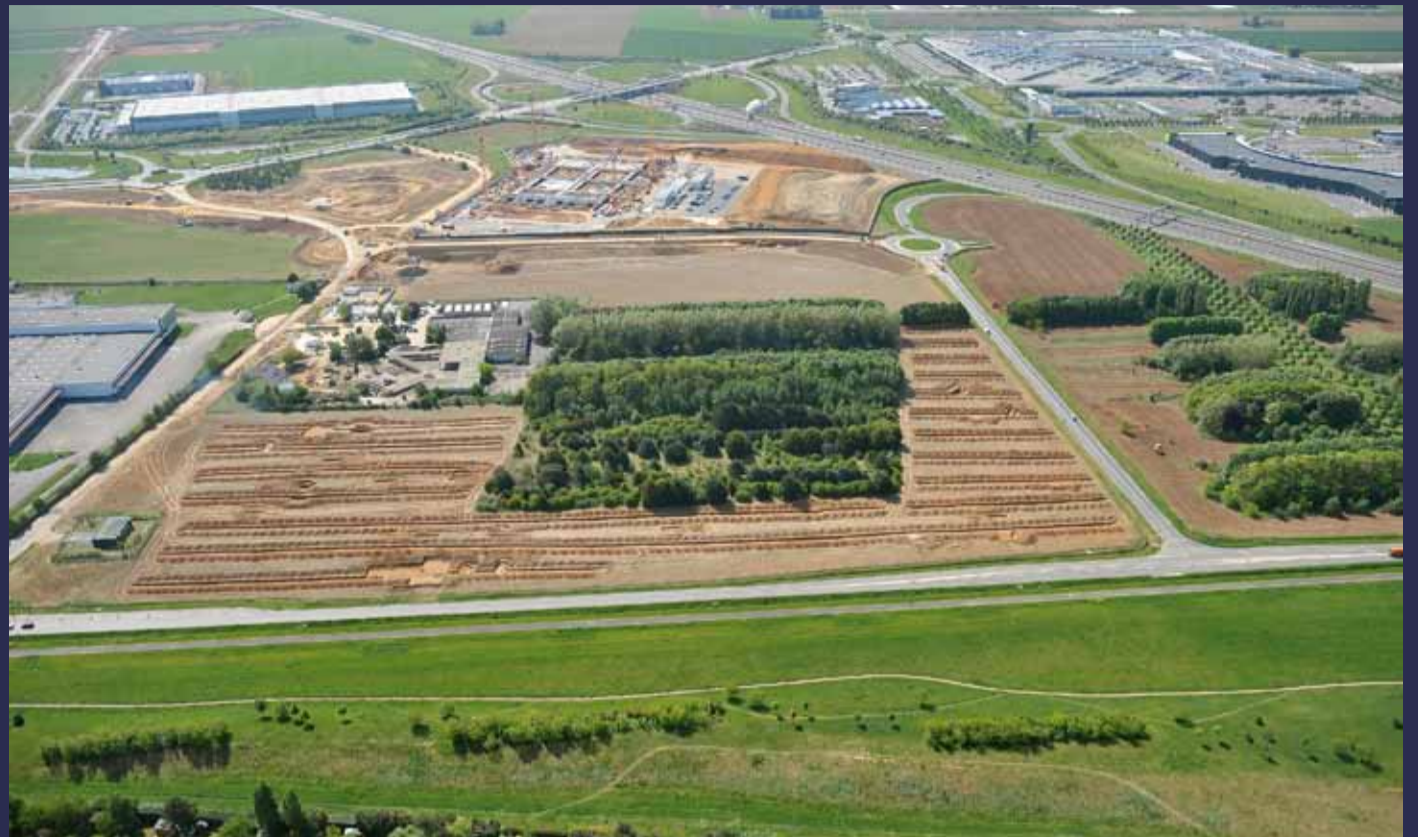
La clinique s'implantera sur 6 hectares, avec une possibilité d'extension sur 5 autres hectares, en face de l'ancienne usine Berger (à l'extrême gauche sur notre photo).